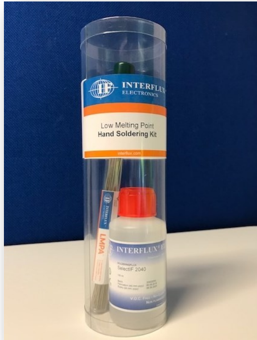
Abgebildetes Produkt kann vom gelieferten Produkt abweichen

Bitte immer das Sicherheitsdatenblatt des Produktes lesen.