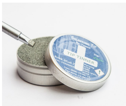
Abgebildetes Produkt kann vom gelieferten Produkt abweichen

Kleine Rauchemissionen sind dem Prozess inhärent. Wie für jeden Handlötprozess, ist eine Rauchabsaugung empfehlenswert.